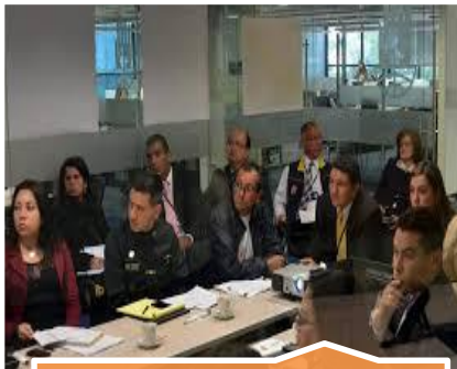
Espacios de coordinación del SNGRD