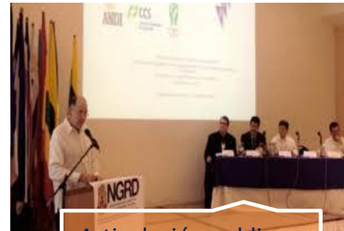
Articulación pública y privada