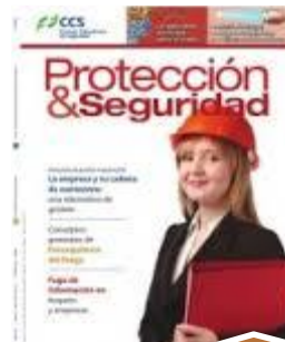
Divulgación de información técnica