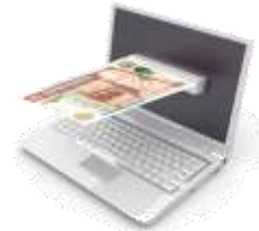
Pagos y recibos en línea