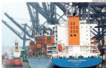
LAS POLILLAS FUERON ENCONTRADAS EN UN CONTENEDOR DEL BUQUE "ANTOFAGASTA".

La Gobernación Marítima de San Antonio confirmó ayer que la temida polilla de origen ecuatoriano que se había encontrado la mañana del sábado en un buque que atrazó en el sitio uno del puerto, fue totalmente erradicada del terminal.