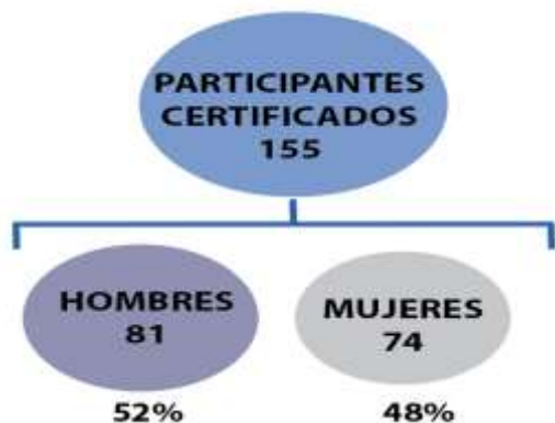
Gráfico No. 1: Participantes certificados

"Excelente curso virtual con un gran apoyo a través de los videos ofrecidos por los facilitadores." (Participante del curso)