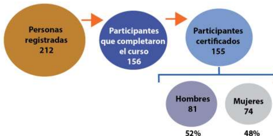
Gráfico No. 2 Personas registradas y certificadas