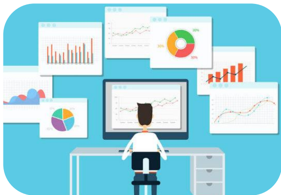
Estatística, Estudos e Meio Ambiente