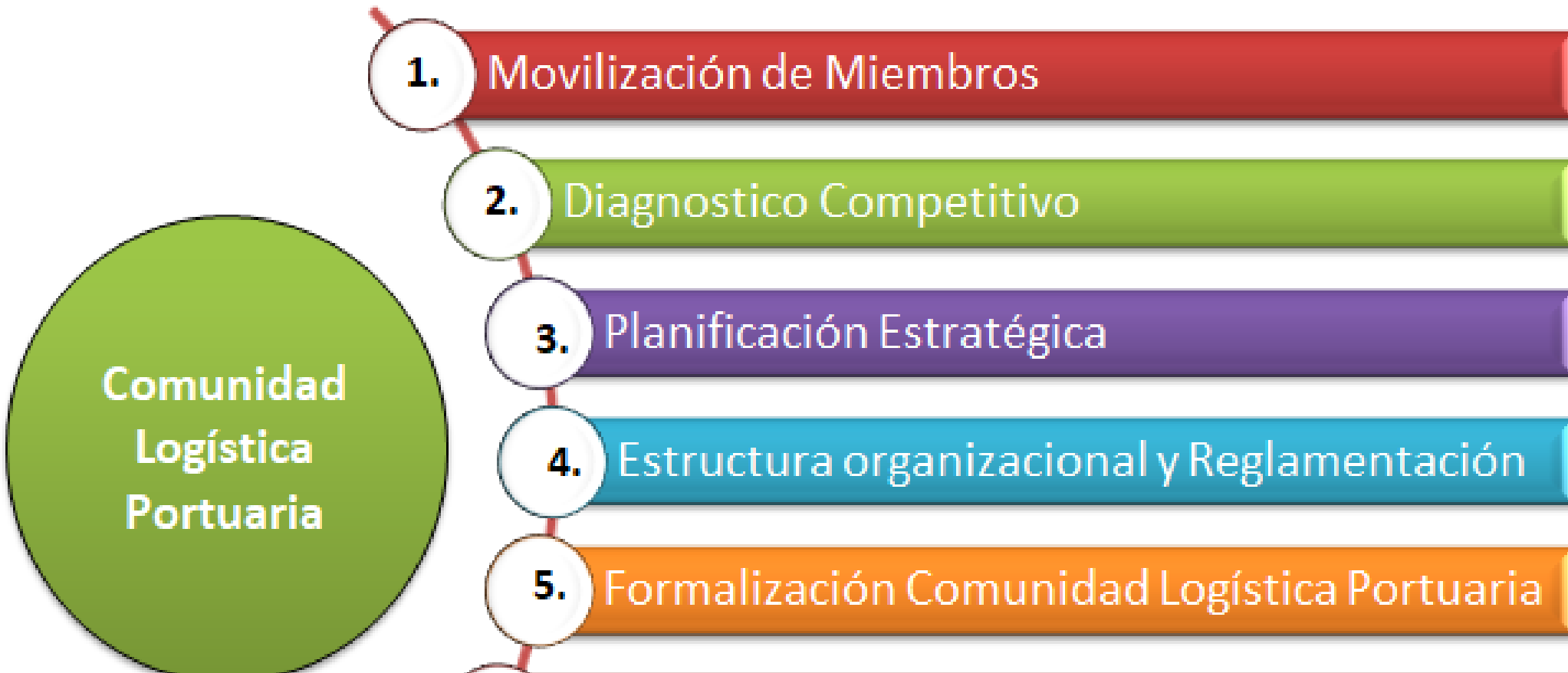
Figura 3 Acciones claves para implementación de una gobernanza logística